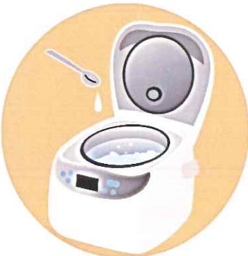
お米1合に対し、小さじ1〜2杯程度 の日本酒を加えるのがおすすすめ♪

日本酒を少々入れると、日本酒に 含まれる糖質のおかげで、お米のつ やと甘みが増します。古いお米もワ ンランクアップさせることができます。